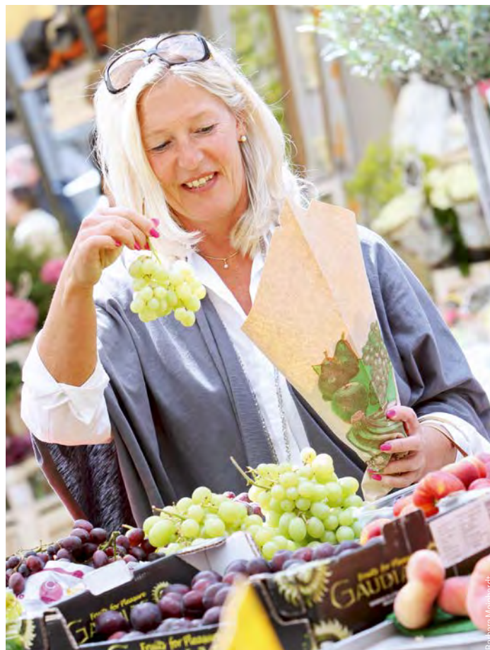
Papiertüten verrotten und belasten somit die Umwelt viel weniger.

Viele Markthändler beobachten inzwischen, dass Kunden Plastiktüten mehrfach nutzen oder andere umweltfreundlichere Einkaufstaschen mitbringen. Die Deutsche Marktgilde selbst geht mit gutem Beispiel voran und verteilt an Markt-Aktionstagen robuste und wiederverwendbare Einkaufstaschen an die Kunden.