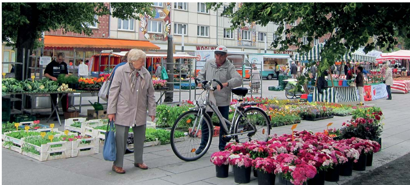
Mitten im thüringischen Sömmerda — in der Marktstraße und auf dem Obermarkt — liegt der schöne und bei Kunden wie Händlern sehr beliebte Wochenmarkt. Neben den frischen Marktwaren sorgen auch stattliche Bäume für ein grünes Flair.