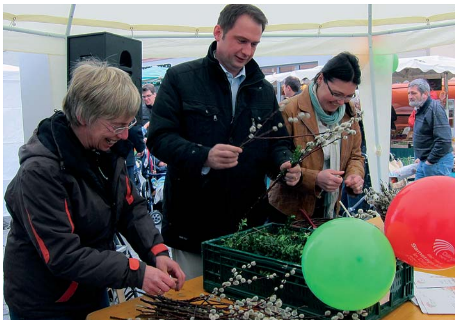
Oberbürgermeister Frank Kunz besucht den Wochenmarkt nicht nur als Kunde, beim "Palmbüschen Binden" im Frühjahr packte er selbst mit an.

Dillingens Oberbürgermeister Frank Kunz setzt sich stark für eine attraktive Innenstadt ein, dazu gehört für ihn ein guter Wochenmarkt, den er deshalb auch persönlich unterstützt. Im Frühjahr hat er auf dem Marktgilde-Wochenmarkt sogar beim Palmbüschen Binden geholfen. "Der Wochenmarkt" hat den "Stadtchef" dazu gefragt: