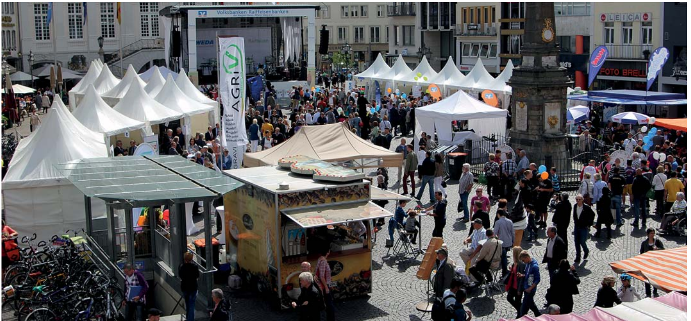
Beim Genossenschaftstag in Bonn wurde der Marktplatz vor dem Alten Rathaus zum großen Festplatz.

Das Jahr 2012 ist für die Genossenschaften ein besonderes Jahr: Die Vereinten Nationen haben es zum "Internationalen Jahr der Genossenschaften" ausgerufen. Auf dem Bonner Marktplatz — in unmittelbarer Nachbarschaft zu "unserem" Wochenmarkt — fand am 1. September aus diesem Anlass der 2. Genossenschaftstag für Rheinland und Westfalen statt.