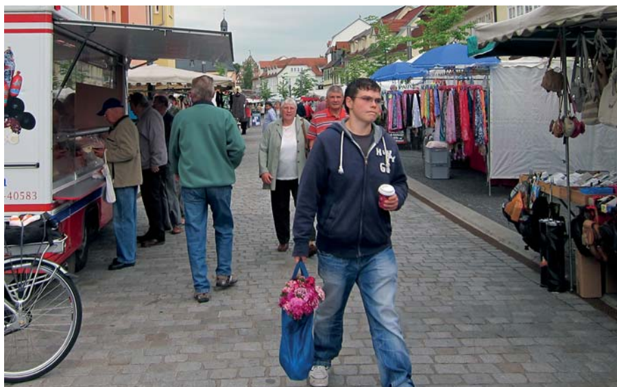
Einkaufen in besonderer Atmosphäre: Ein umfangreiches und hochwertiges Sortiment mit freundlichen Beschickern ist auch in Sömmerda die Voraussetzung dafür.

Die Marktbesucher haben vom neuen „leichten frischen Wind“ auf dem Wochenmarkt bei einer Aktion bereits etwas gespürt. Am 6. September wurden die Frühaufsteher mit einer Rose belohnt und Gutscheine sowie Einkaufstaschen unter allen Marktkunden verlost.