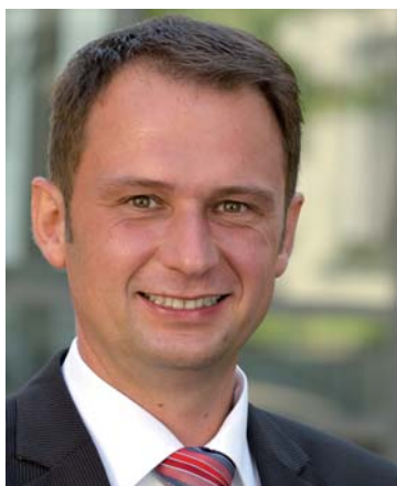
Oberbürgermeister Frank Kunz

Dillingens Oberbürgermeister Frank Kunz setzt sich stark für eine attraktive Innenstadt ein, dazu gehört für ihn ein guter Wochenmarkt, den er deshalb auch persönlich unterstützt. Im Frühjahr hat er auf dem Marktgilde-Wochenmarkt sogar beim Palmbüschen Binden geholfen. "Der Wochenmarkt" hat den "Stadtchef" dazu gefragt: