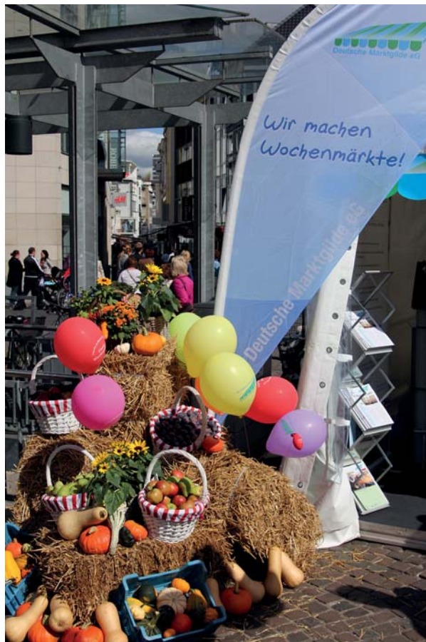
Der einladende Info-Stand der Marktgilde beim Genossenschaftstag in Bonn.

tag zeige "den Ideenreichtum, den 2,8 Millionen Menschen in Rheinland und Westfalen in genossenschaftlichen Zusammenschlüssen hervorbringen". "Wer sich in einer Genossenschaft engagiert, der hat aufgehört, mit seinem Schicksal zu hadern oder Lösungen von anonymen Verantwortungsträgern einzufordern. Die Ohnmacht weicht der Eigeninitiative — das ist es, wofür Genossenschaften stehen." Peer Steinbrück, Festredner aus Anlass eines "politischen Frühstücks" am Rande des Genossen-