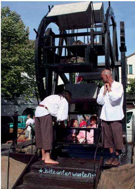
Der historische Markt aus der Zeit des "Alten Fritz" war die Attraktion des Wochenmarktsjubiläums. Das handbetriebene Karussell wurde von den kleinen Marktbesuchern regelrecht gestürmt.

Den beliebten Mindener Wochenmarkt auf dem Martinikirchhof gibt es schon seit einem halben Jahrhundert, ein guter Grund, das Jubiläum ganz groß zu feiern!