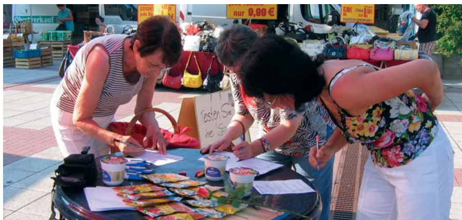
Ein Quiz mit Sofortgewinnen ist besonders bei den Marktkundinnen sehr beliebt.

Beim ersten Markt unter der DMG-Regie wurden die Kundinnen mit einer Rose begrüßt, und alle Besucher konnten ihre Spargelkenntnisse bei einem Quiz unter Beweis