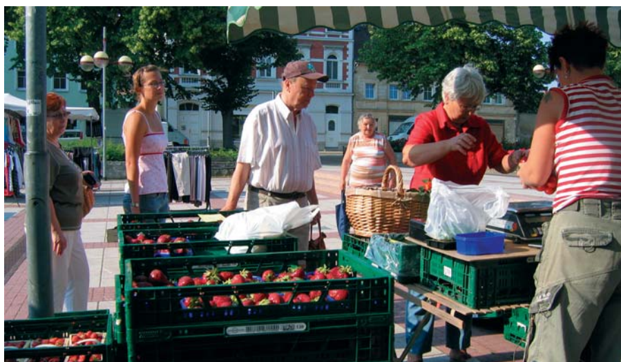
Frische Erdbeeren aus der Region waren der “Sommerrenner” auf vielen Wochenmärkten, so auch in Groitzsch.