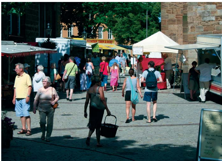
Der neue grüne Wochenmarkt am Kleinen Domhof hat sich in kurzer Zeit zum Publikumsmagneten entwickelt.

Die aus städtischer Hand übernommenen Wochenmärkte liegen auf historischen Flächen in der oberen Altstadt zwischen der Schwedenschenke, der Martinikirche und dem alten Arsenal. Gerade der Samstagmarkt ist sehr gut bestückt mit mehr als 30 Händlern, die eine große Sortimentsbreite und -tiefe anbieten. An den beiden anderen Markttagen (Dienstag und Donnerstag) kommen rund 10 bzw. 20 Beschicker auf den Martinikirchhof. Hier ist eine Ergänzung mit einzelnen Sortimenten noch möglich. Durch die örtlichen Gegebenheiten