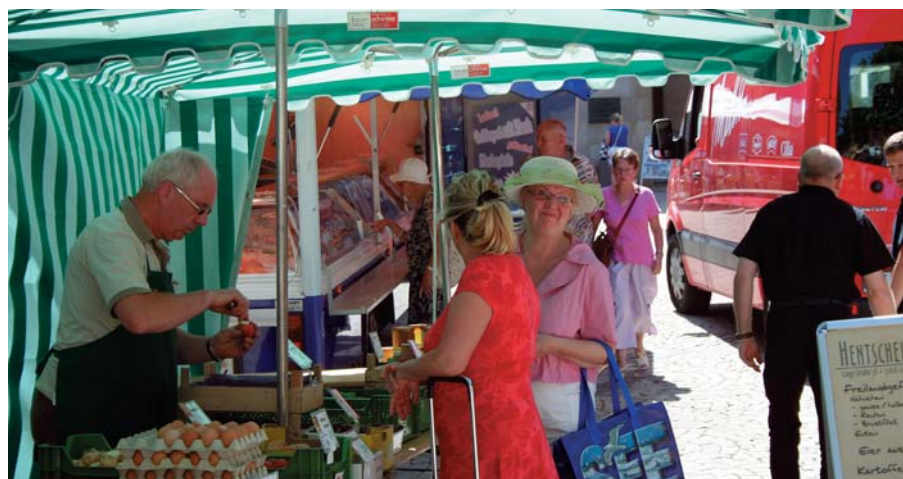
Freundliche Händler und zufriedene Kunden bestimmen das Bild auf den Mindener Wochenmärkten, hier wird Einkaufen zum Genuss. So auch am Marktstand von Hentschel's Hofladen mit vielen Produkten aus eigenem Anbau.