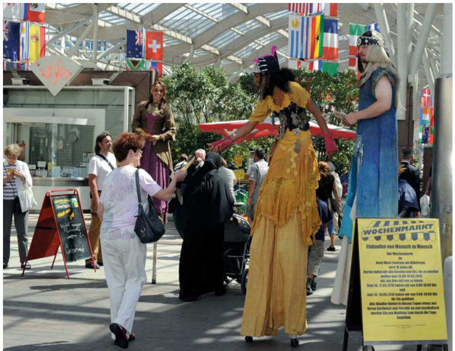
Die mittelalterlichen Stelzenläufer verteilten "imposant" Handzettel bei den Kunden im Nordwest Zentrum.