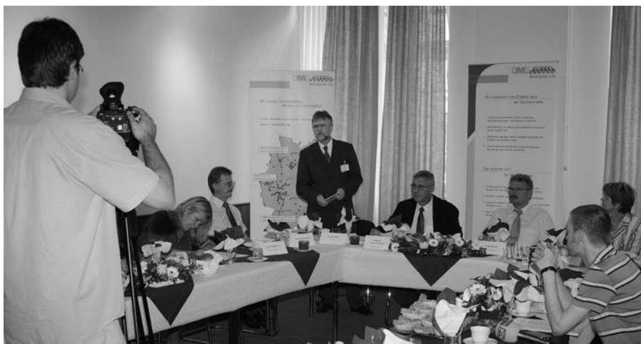
Ein Dutzend Journalistinnen und Journalisten war der Einladung zum Marktfrühstück gefolgt.

Es wurde das neue Marktkonzept, das von der DMG mit der Bundes-