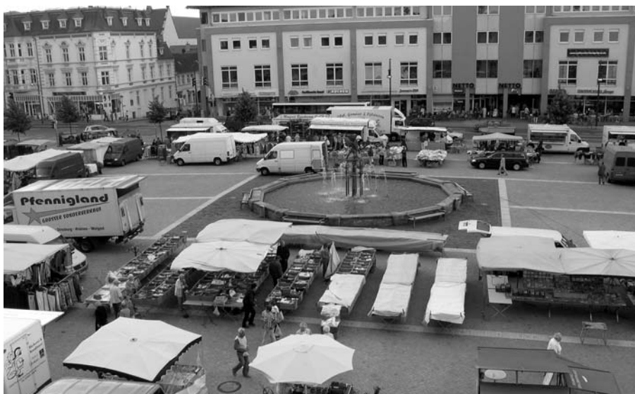
Zentral gelegen auf schönem Marktplatz - kommen mittwochs rund 45 Marktbesucher zum Wochenmarkt in die Hansestadt Anklam.

Seit Juli zählt auch die Hansestadt Anklam dazu. Einstimmig hatte der Hauptausschuss der Stadtvertretung im Juni die DMG mit der Organisation des Wochenmarktes beauftragt. „Unser Markt-Konzept, den Frischebereich zu stärken und heimische Händler den Händlern mit langen Anfahrtswegen vorzuziehen, hat in der Hansestadt überzeugt“, freut sich Brigitte Weigel. Schon einige Male hat sie den Weg von Limbach-Oberfrohna bis fast an