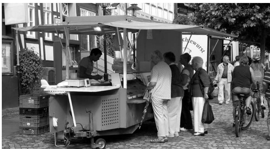
Urlaubererinnerungen gibt es beim Feinkosthändler abgepackt im Schälchen. Nicht nur in Stadtoldendorf eine Bereicherung und ein gern besuchter Markthändler.